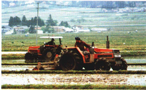
田起こし・しろかき

たねを水にひたし、4月中ごろ種まきをします。まいたあと、温度や水に気をつけています。ビニールハウスで約1ヵ月かけて育てます。