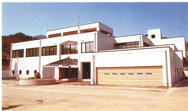
喜多方地方水道用水供給企業団