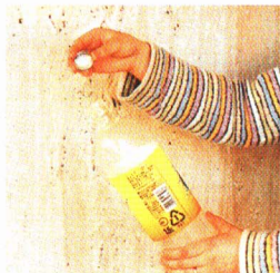
①キャップをはずす。