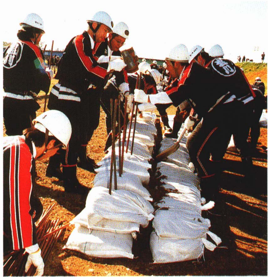
ぼうさい 防災くんれん

塩川町では、「防災まちづくり計画」をつくり、大雨でも安心してくらすせる「すいがい 水害に強い町」をめざしています。