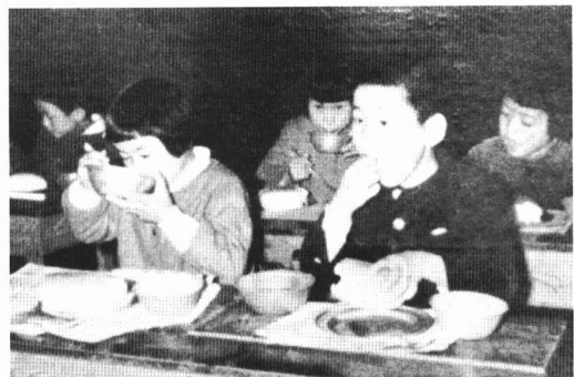
むかしの給食（昭和35年ごろ）