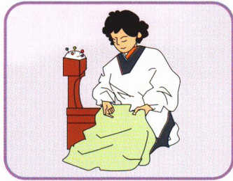
はりと糸で手ぬい