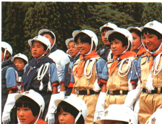
上○山都二小の火防団防火パレード （児童数53名）