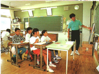
下○山都三小の授業風景 （児童数21名）

育環境の整備を図るとともに、プール、グラウンドなど屋外教育環境の整備も合わせて図る必要があります。また、高度情報化社会への対応としてパーソナルコンピューターなどを積極的に活用した情報化教育を継続するとともに、教材等の整備をさらに図らなければならないと考えています。