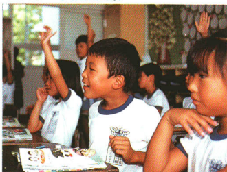
○山都一小授業風景