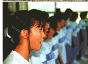
○山都中学校の合唱部 今年、東北大会に出場した