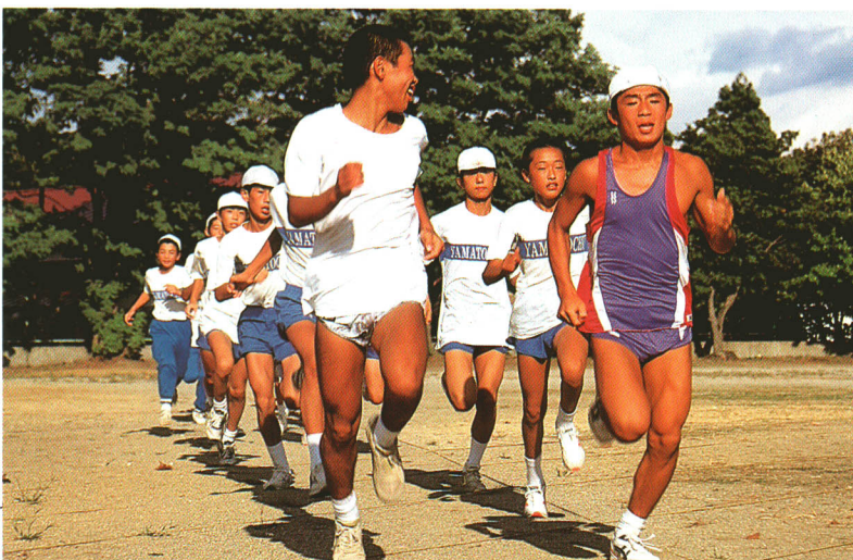
○山都中学校の陸上部