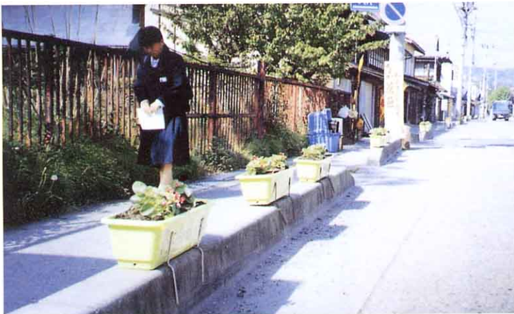
歩道におかれたフラワーポット

町の花いっぱい運動に協力して、歩道や店の前などにフラワーポットをおいたり、暗くても安心して歩けるようにがい灯 どりょく をつけたりして、明るく美しい商店がいにしようと努力 どりょく しています。