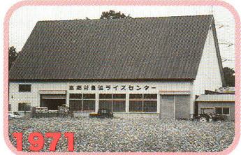
1971 昭46 第二ライスセンター落成