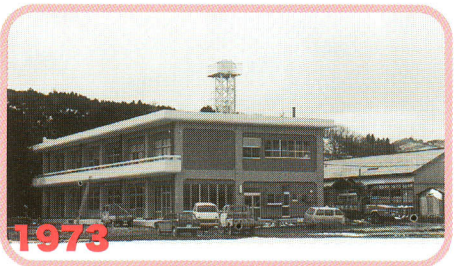
1973 昭48 高郷村公民館落成