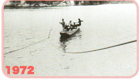
1972 昭47 渡し舟はロープをたぐって対岸へ