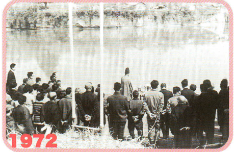
1972 昭47 川井船場閉鎖の祈り