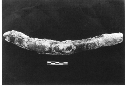
肋骨の化石 (スケールは10cm)