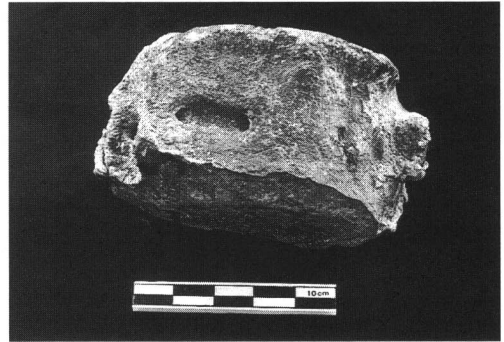
尾の背ほねの化石 (スケールは10cm)