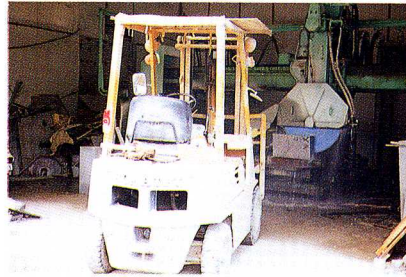
▼クレーンが設置された工場内