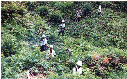
▼刈払機を使つての下刈