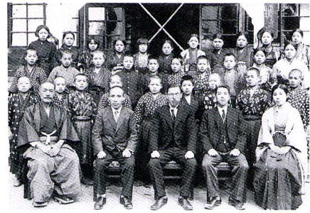
山郷尋常小学校 (明治44年 けんちく 建築) 昭和11年ころの卒業生

新郷 じんじょう 尋常高等小学校は、河沼郡新郷村西羽賀に、西海枝 さいかち 尋常小学校は、耶麻郡山郷村西海枝（吹屋）に、山郷尋常小学校は、耶麻郡大谷村大谷にそれぞれ た 建てられました。