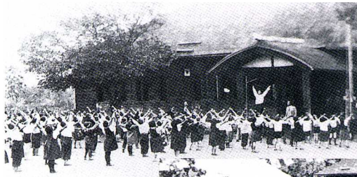
西海枝尋常小学校 (明治45年 けんちく 建築)