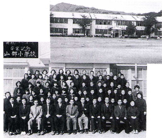
山郷小学校（今の高郷第二小学校）