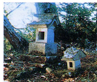
史跡 春日神社石祠 (小ヶ峯)