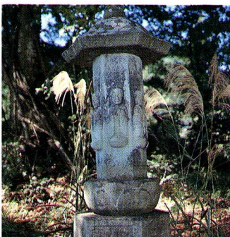
民族資料 六地藏石幢 (西海枝)