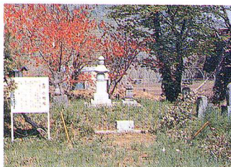
史跡 伝小野小町塚 (松原利田)