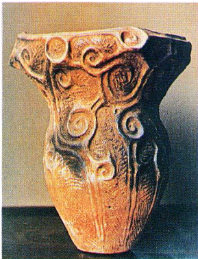
考古資料 甕型土器 (夏井)