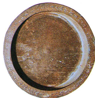
工芸 銅製双盤 (西羽賀)