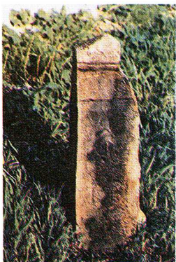
こうこしりょう 考古資料 あみださんぞんしゆし 阿弥陀三尊種子 くようとう 供養塔 (赤岩)