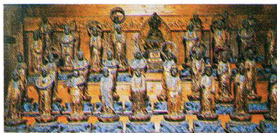
ちょうこく 彫刻 木造三十三観音立像 (吹屋)