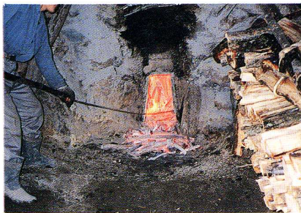
▲すみ焼きのようす