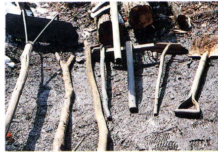
▲すみ焼きに使った道具

山の仕事以外にも「こうぞ」の木や「みつまた」の木の うちかわ 内皮を利用して「和紙」をつくる「紙すき」やうるしの実をしぼってかためて「きろう」つくりもさかんに行われました。そのほかに「かいこ」を か 飼って「まゆ」を取ったり、自分の家で「はた(布)」を お 織っていました。冬の間には「なわない」や「むしろおり」などをやっていました。