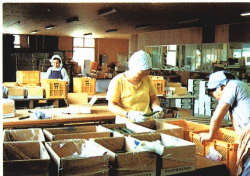
▲農協 あつ に集められた農作物のはこづめ