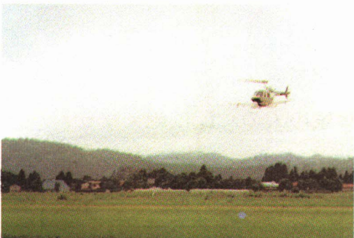
▲ びょうき 病気からいねを まも 守るために、 しょう 消どくをします。ヘリコプターを使つての こうくうぼうじょ 航空防除を行うこともあります。