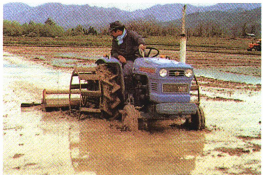
▲田植えをする前に しろ 代かきをして田の土を平らにします。