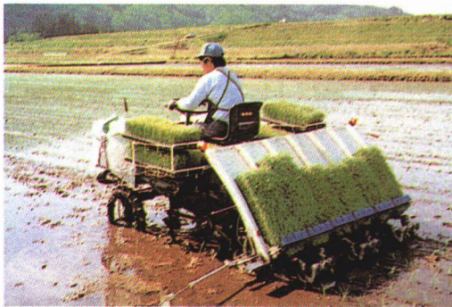
▲ きかい 機械を使つての田植えの仕事は、手で植えるより早く仕事をおえることができます。