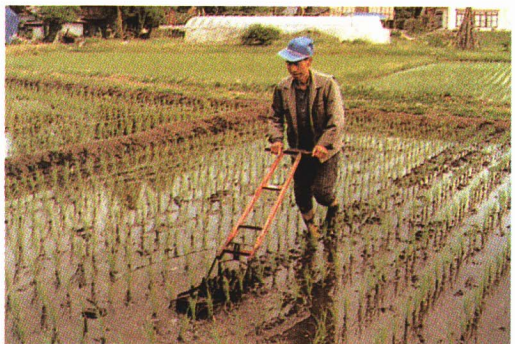
▲ なえ 苗を大きく育てるために、 そだ 草とりをしたり、草がはえないように除草剤をまいたりします。