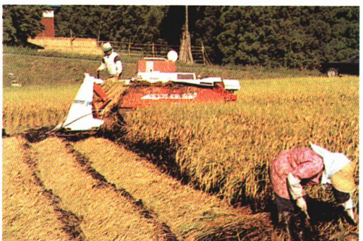
▲かりとりとだっこくを どうじ 同時にできるコンバインを使つて しゅう 収かくします。