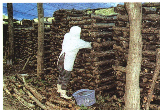
▲しいたけの しゅう 収かく