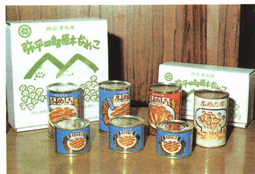
▲なめこのかんづめ