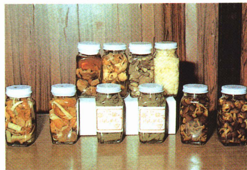
▲ さん 山さいのびんづめ