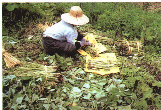
▲ふきを「かま」でかりとり、 は 葉をとってから、たばねている。

山からは、ざい木のほかに、きのこやいろいろな山さいがとれます。 町では、この山のめぐみを利用して、きのこや山さい作りの しごと 仕事をしている人もいます。