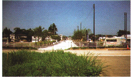
▲国道ぞいの新しい道路

いろいろな店 しょうてん 商店がいには、同じ種類 しゅるい の商品 しょうひん だけを売っているせんもん店や、いろいろな種類の商品を売っているごっか店、広い売り場の中に、生活 ひつよう に必要なものがほとんどそろっているスーパーマーケットなど、いろいろな店があります。