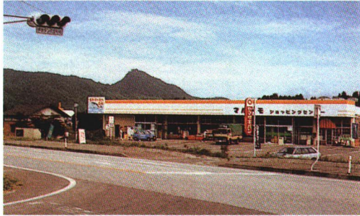
▲国道ぞいのスーパーマーケット

国道49号のバイパスぞいには、広いちゅう車場 しやじょう があるスーパーマーケットがいくつかできてきています。この地域 ちいき には、これからも大きなせんもん店やスーパーマーケットがたくさんできて、活気 かつき のある商店がいになっていくだろうと期待 きたい されています。