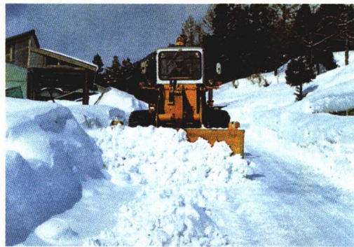
▲タイヤドーザによる除雪

国道49号や国道459号は国で除 雪し、喜多方西会津線など2本の 県道は県で除雪します。