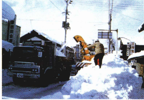
▲ロータリーによる除雪

いますが、業者にもたのんで除雪 しています。ふった雪が15cm以上 になると、町から除雪機械の運転 手に電話が入ります。運転手は、 奥川・野沢・新郷の3つのステ ーションから除雪機械を出動させ、 199の町道の除雪を行います。