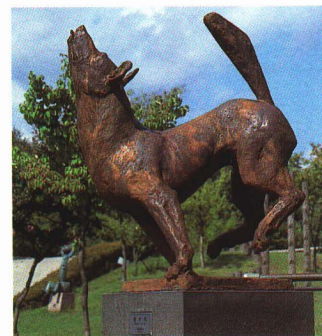
▲さゆり公園のブロンズ像管理センターなどがあります。

1周400mで6コースとれるトラック、走り幅跳用砂場があり、そのほかにもサッカー、ラグビーなどいろいろなスポーツが楽しめます。また、ふるさとまつりや雪国まつりなどのよおし物の会場になることもあります。