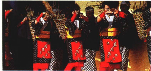
▲草かりおどり (野沢)