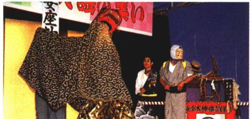
▲安座かぐら あざ (安座)