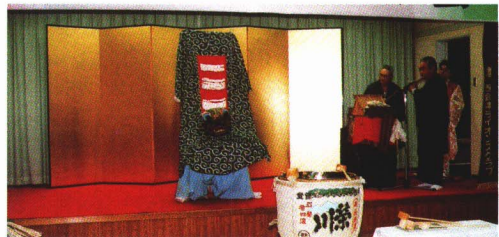
▲太々かぐら だいだい (下小島)