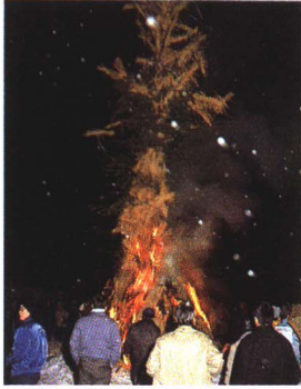
▲歳 さい の神