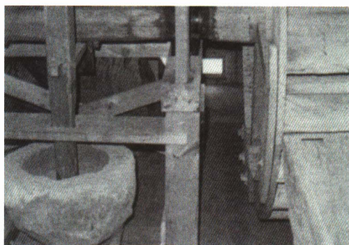
▲水車の中の石うす

いねかりをしたあと、よくかん そうさせると、<せんばこき>で いねこきをし、<とうみ>でごみ をとってもみにしました。もみは <するす>でひき、<万石 まんごく >にか けて玄米 げんまい にしました。玄米はくば ったり>や<水車 すいしゃ >にかけて米つ きをして、<とおみ>でふいてぬかをのぞいて、ようやく食べられる 白米にしました。