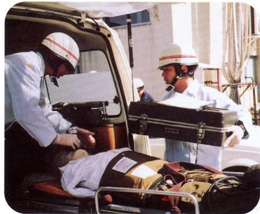
大けがをした人の救出くんれん