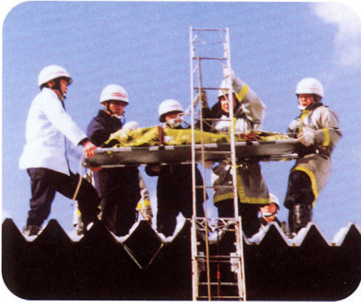
さんれん きゅうしゅつ 三連はしごを使った救出くんれん