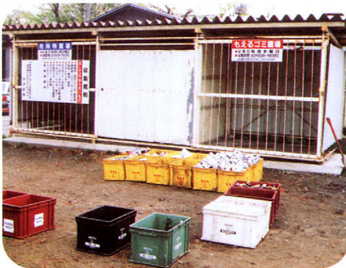
ごみステーション

わたしたちが生活していくなかからたくさんのごみが出てきます。そのしゅるいもいろいろで、紙などもえるものから、金ぞく、ガラスなどもえないもの、生ゴミ、プラスチックなど、もやすと体によくないけむり（*ダイオキシン るい 類）の出るものがあります。