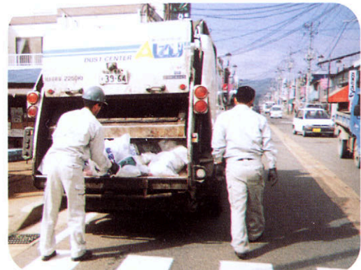
ごみしゅう集のようす