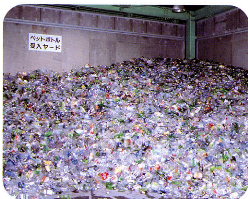
運ばれたペットボトル