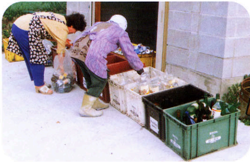
しげん物回収ボックス