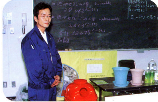
リサイクルからできたもの（服、ゴミ箱、植木ばちなど）