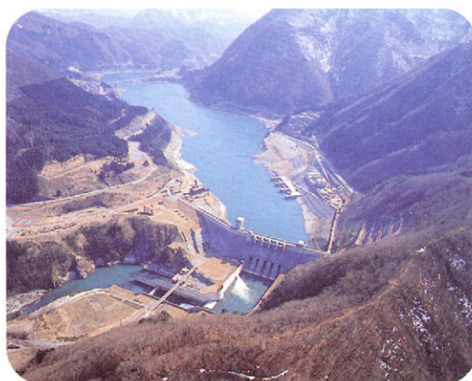
おおかわ 大川ダム