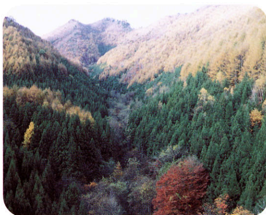
みなみあいづ やまやま 南会津の山々

それらの雨を大川ダムにため、会津本郷町にある馬越じょう水場に送り、水をのめるようにきれいにします。それから、地面の下にうめられた太い水道管を通って、会津坂下町に送られます。