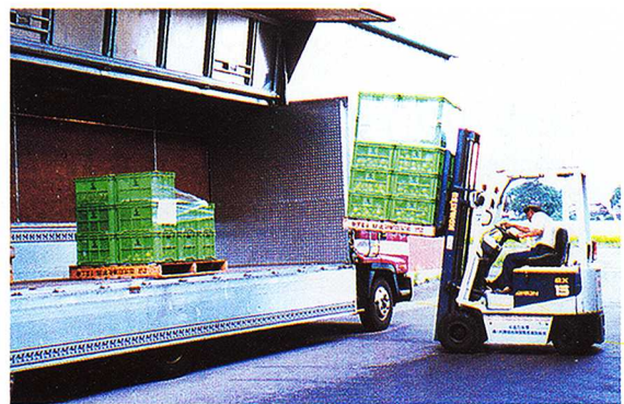
農作物の出荷作業(県内・関東地方・京浜地方へ)