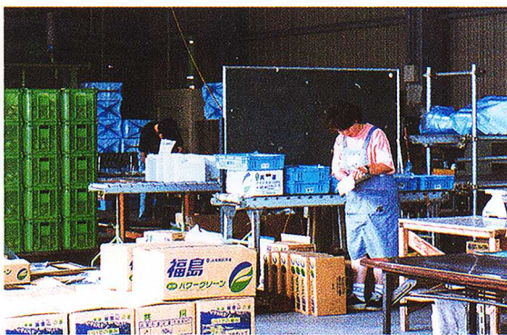
農協に集められた農作物の箱詰め作業 はこづ