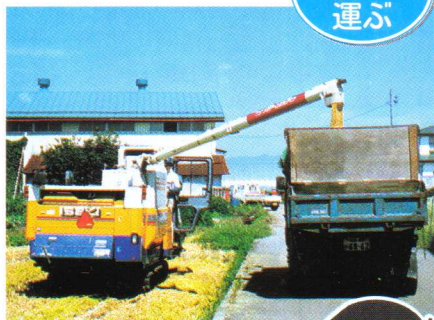
もみを はこ 運ぶ