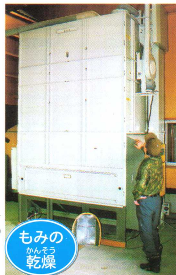
もみの かんそう 乾燥