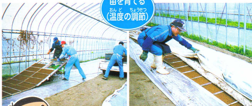
苗を育てる おんど ちょうせつ (温度の調節)