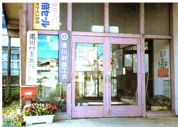
商 工 会

これらのほかにも、11月初旬 しよじゆん ひら に開かれる村の文化祭 ぶんかさい には、商工まつりを計画 けいかく し、それぞれのお店が、いろいろな品物を安く やす 売ります。