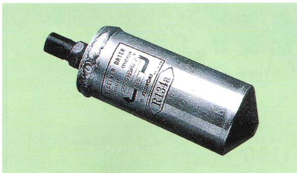
大型エアコンの部品