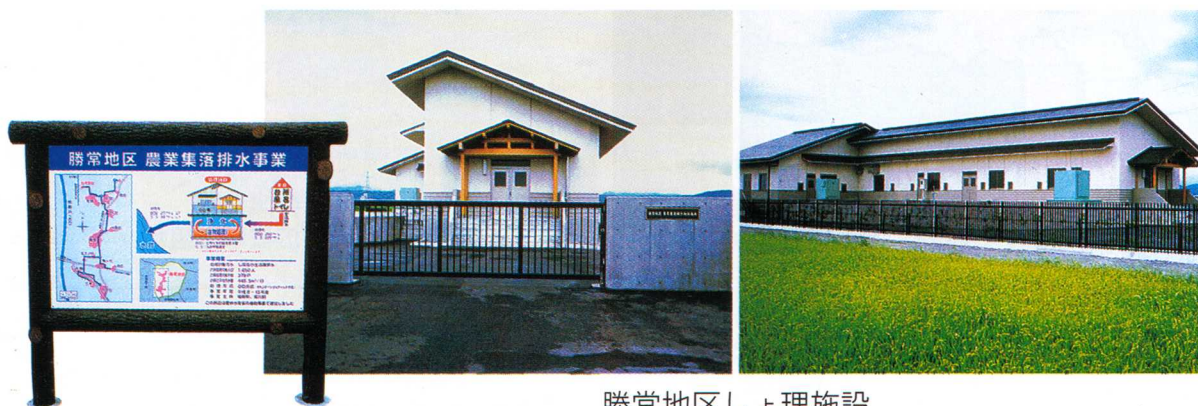
勝常地区しよ理施設