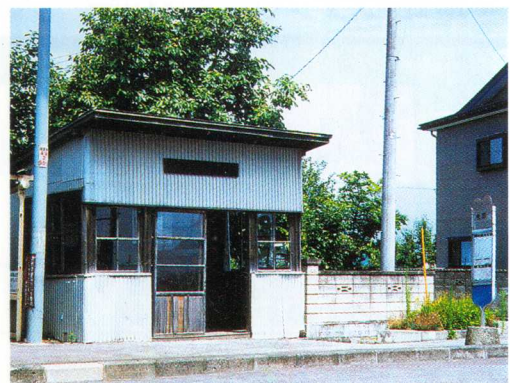
会津若松坂下線(49号)佐野停留所

バスは、会津若松市内の買い物や電車利用にもべん利で多くの人の足として、したしまれてきました。自家用車 じかようしゃ がふえるとバスを利用する人が少なくなり、廃止 はいし された路線もあります。しかし、今でもなくてはならない大切な乗り物です。