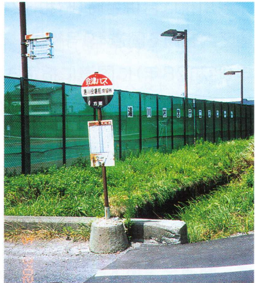
湯川役場前停留所