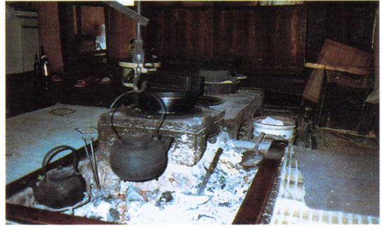
「いろり」・「鉄びんとじざいかぎ」