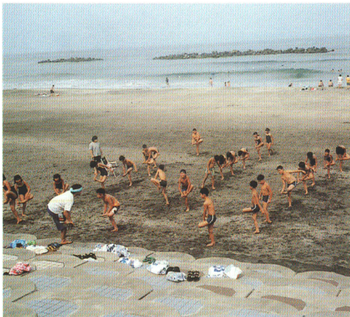
▲ジュニアリーダーズスクール