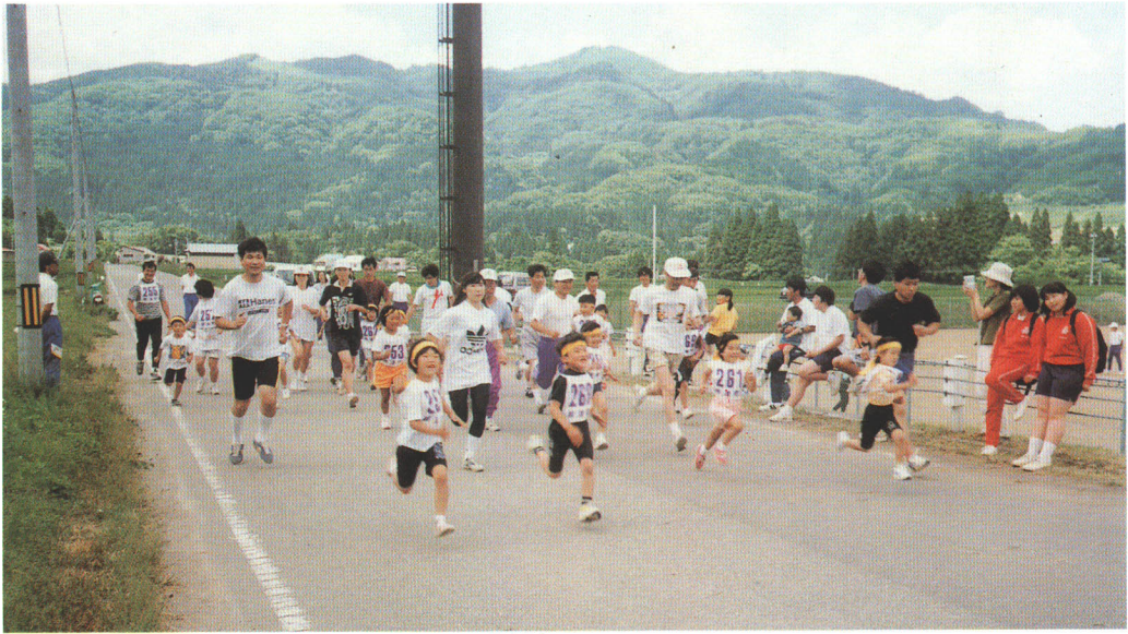
▲ けんこう 町民健康マラソン大会

★ 地図や写真を見て、 こうみんかん 公民館の活動について しら 調べてみましょう。