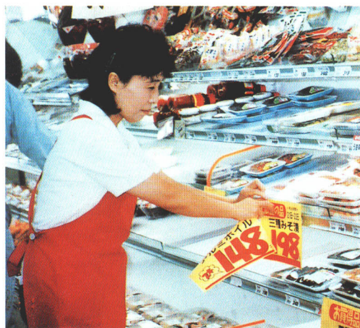
▲安売りの表示 ひょうじ をしているところ