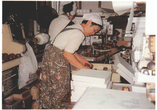
▲はこづめをする人