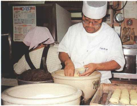
▲あわまんじゅうをつくる人