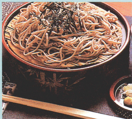
▲ はかせ 博士そば