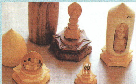
▲ びといちょうこく 微細彫刻