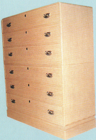
▲ きりこうげいひん 桐工芸品 (タンス、 こと 琴、 げた げた)