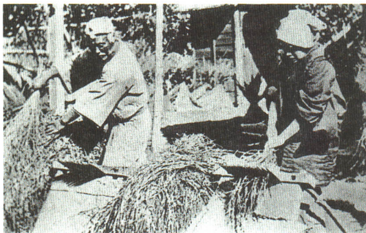
▲むかし いね 昔の稲こき

このあと“とうみ”でごみをとり、もみを“するす”でひき、“ばったり”や“水車” すいしゃ にかけて はくまい 白米にしました。