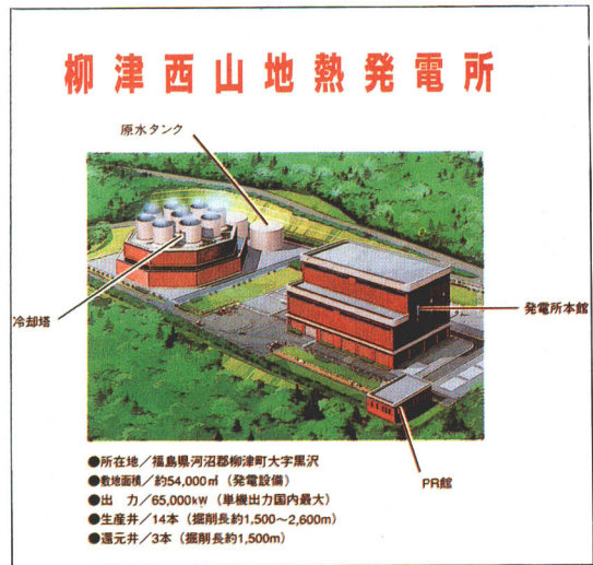
▲柳津西山地熱発電所