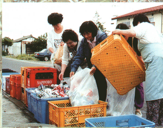
分別収集によりゴミの減量化

努めていきます。下水道については公共用水域の水質汚濁の防止と生活環境改善のため、公共下水道事業や農業集落排水事業を推進しています。農業集落排水事業は農業用排水の水質保全と農村生活改善などの役割を担っており、対象地域以外には合併処理浄化槽の普及を図っていきます。