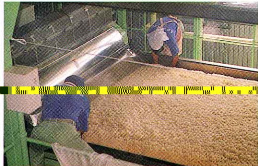
▲お米にこうじ菌をまぜ、こうじをつくります