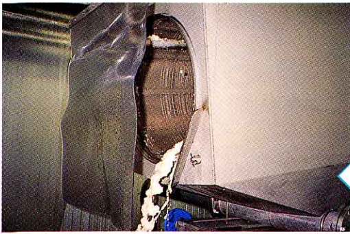
▲お米をあらいます