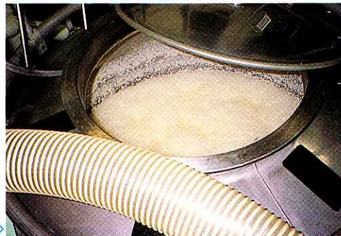
▲タンクに入れ、はっこうさせます