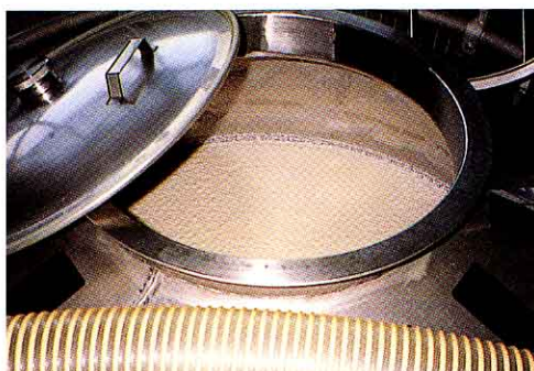
▲白くにごったもろみができます