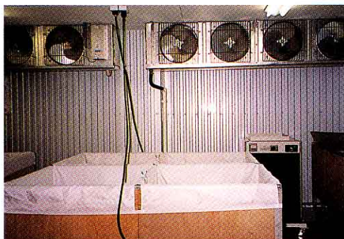
▲こうじをひやします