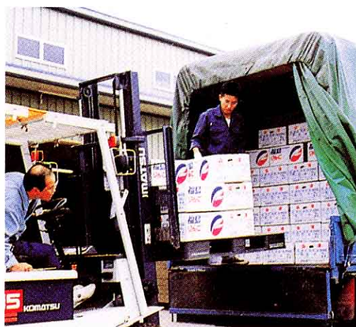
▲りんごの出荷作業（県内や関東地方へ）