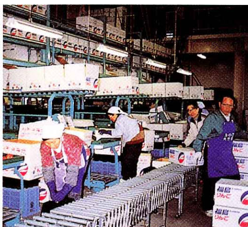
▲選果場 せんかじょう に集められたりんごの箱づめ