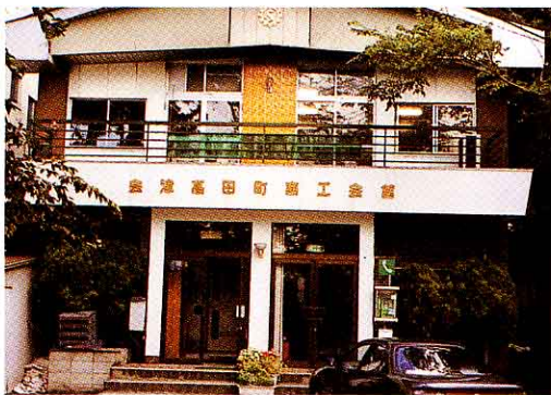
▲会津高田町商工会館

初市 (1月) 大俵引き (1月) 文殊祭出店 (2月) アイリスフェスティバル (5月) あやめ祭り, 高田梅種とばし選手権 (6, 7月) 中元大売り出し (7, 8月) お田植祭, 盆踊への協力さんか (7, 8月) 大バザール出店 (11月) 大売り出し (年末) (12月)