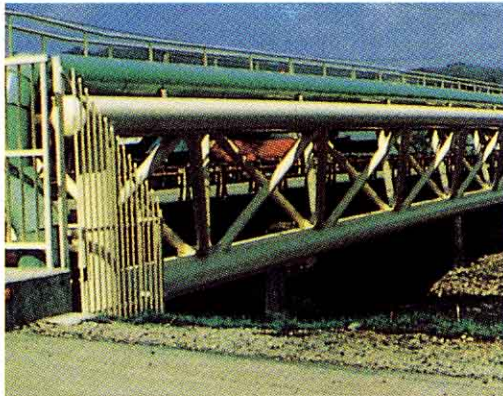
みやせすいかんきょう ▲宮瀬水管橋