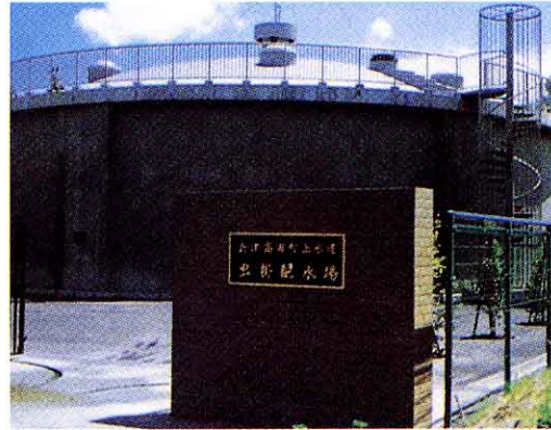
むしかげはいすいち ▲虫掛配水池

会津高田町では、平成12年度までに水道を広げて、14300人に水を おく 送り、町の人びとのほとんどが水道を使えるようになるように、工事 を進めています。