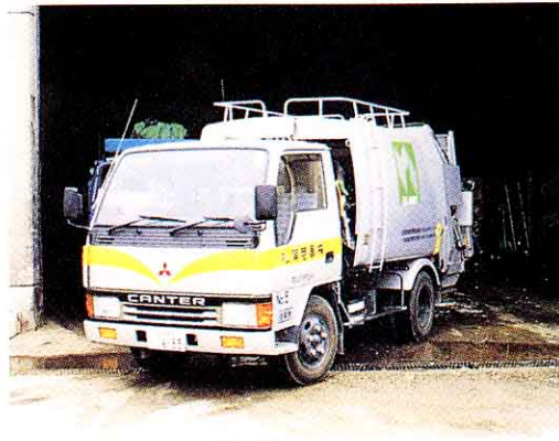
▲ごみをピットに投入している車 とうにゆう