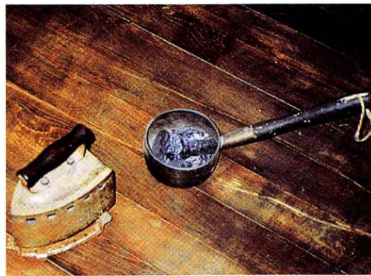
▲アイロン (左) ・火のし